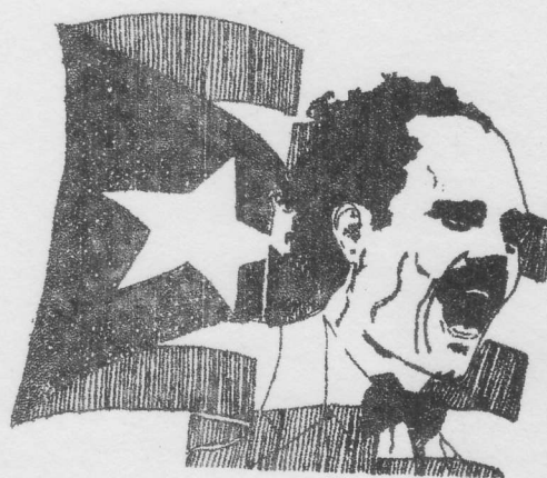
PEDRO ALBIZU CAMPOS