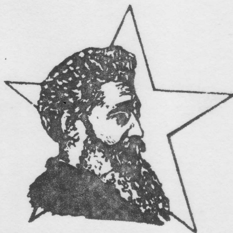
RAMON EMETERIO BETANCES